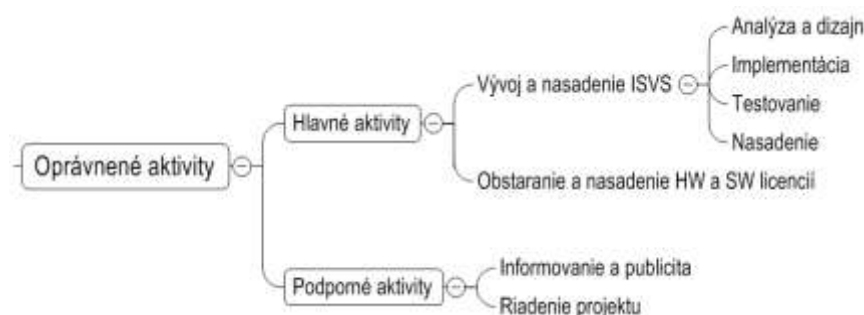
Obrázok 1 štruktúra oprávnených aktivít

Z vecného hľadiska sú oprávnené tie aktivity, ktoré sú nevyhnutné na sprístupnenie služieb eGovernmentu požadovaných v písomnom vyzvaní. Oprávnené aktivity sa členia na hlavné aktivity a podporné aktivity. Oprávnené aktivity môžu byť výzvou, resp. písomným vyzvaním definitívne vymedzené.